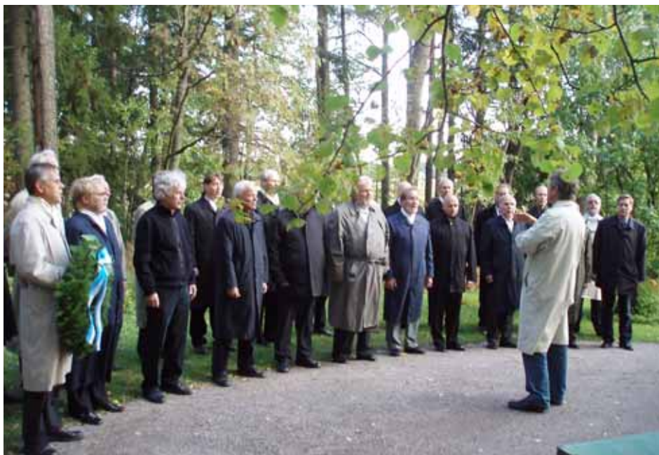
Laulu-Miehet Ainolassa 20.9.2007.

torstaiamuna, syyskuun 20. päivänä Sibelius tunsi huimausta. Siitä huolimatta hän luki lehdet vuoteessa ja pukeutui sitten. Kello yhden aikaan Sibeliuksen istuessa aamiaispöydässä hän yhtäkkiä lyyhistyi kokoon. Hänet autettiin vuoteeseen. Lääkäri totesi Sibeliuksella olleen aivoverenvuodon. Sibelius oli vielä taivissaan, mutta hänellä todettiin olevan jo halvaantumisen oireita. Kello neljän aikaan hänen tajuntansa pimeni ja kello yhdeksän aikaan illalla (klo 21.15) hän nukkui pois. Kuolinhetkellä yliopiston juhlasalissa soi Sibeliuksen viides sinfonia edellä mainitun Sir Malcolm Sargentin johtamana. Yleisradio keskeytti myöhäislahetyksen paria minuuttia vaille klo